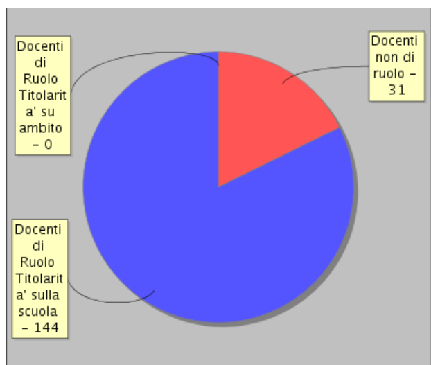
Distribuzione dei docenti per tipologia di contratto